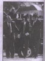
FÅR HJELP: Michael Jackson får hjelp av sin bror Jackie Jackson (til høyre) og en livvakt for å komme seg inn i rettslokalet i Santa Maria i California.