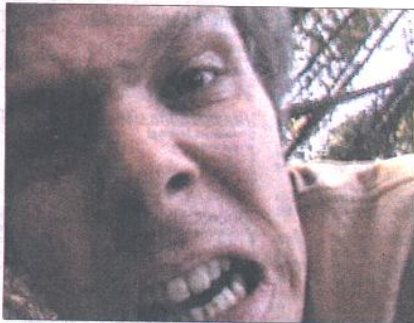
STILLBILDE: Fra Ole Mads Vevles intense videofilm But, What's it All About.